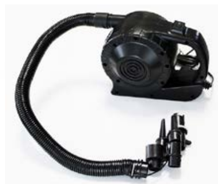
Gonfleur électrique 400 W