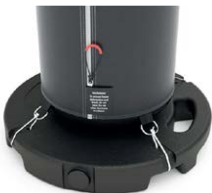
Socle béton 10 kg X4

Ce volume de personnalisation plus grand implique que les tentes prennent davantage le vent et l'arrimage adapté est donc nécessaire pour une utilisation sans problème.