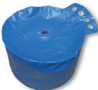
Poche lestable 10 L X4